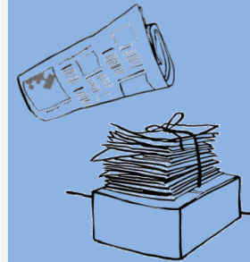
Kanta za stari papir